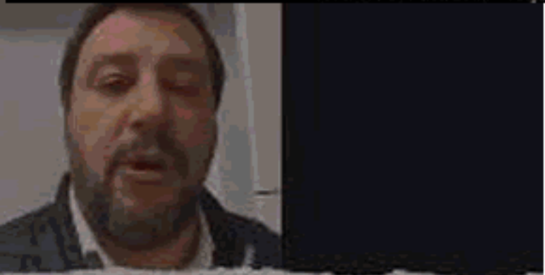
Matteo Salvini "Riaprite tutto" - 27 febbraio 2020