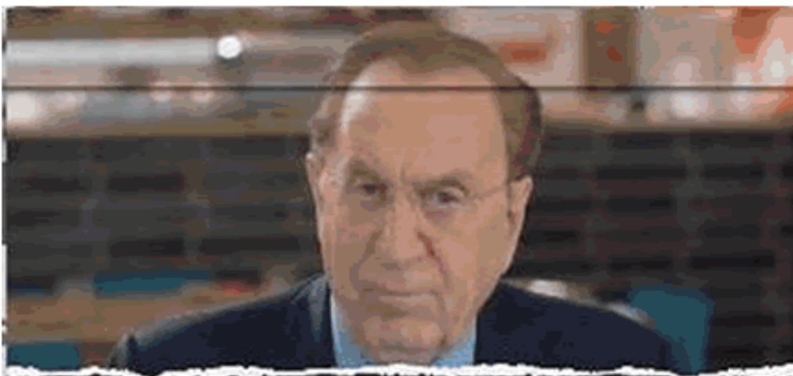
Michele Mirabella - spot istituzionale "Il contagio è difficilissimo" - 8 febbraio 2020