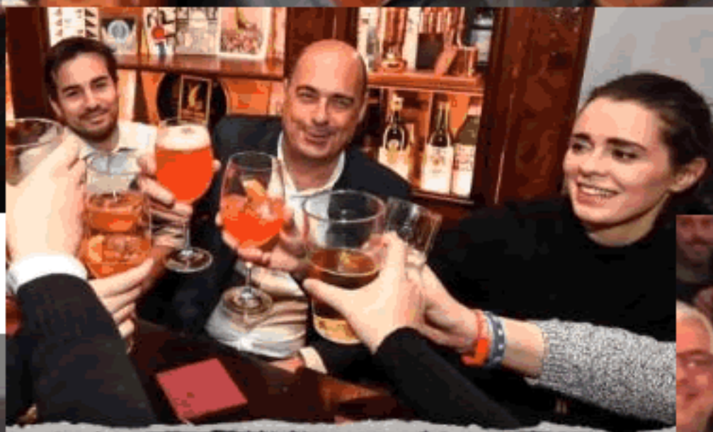
22 febbraio Nicola Zingaretti