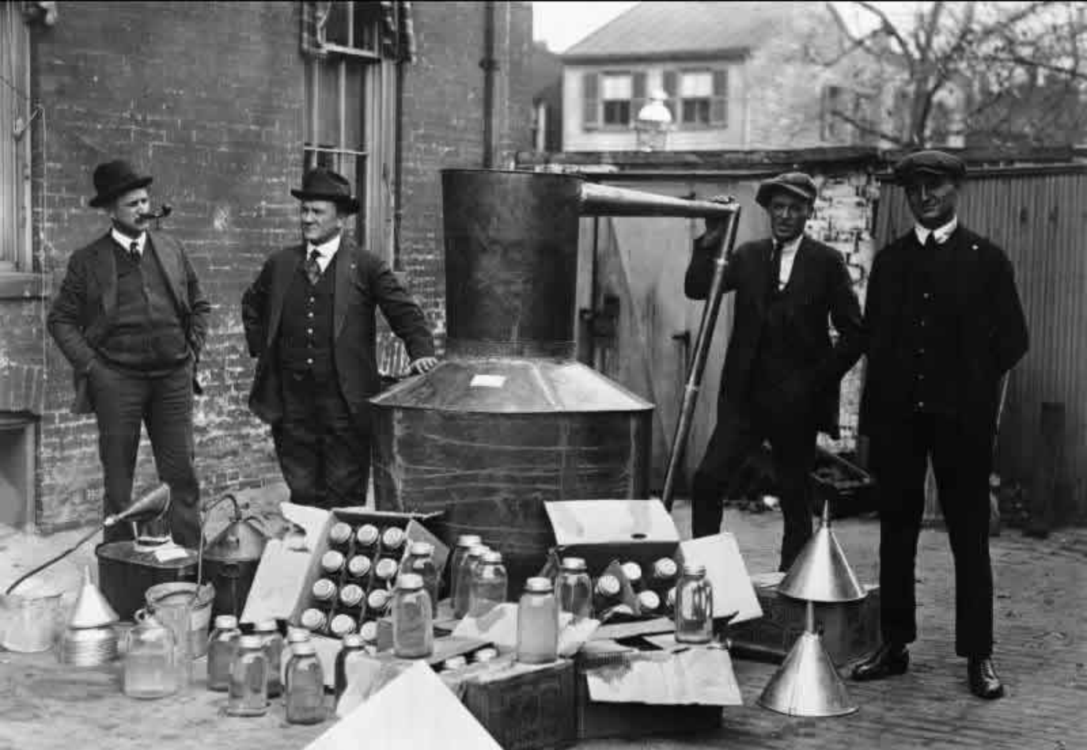
La risposta al proibizionismo