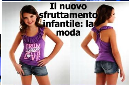
Il nuovo sfruttamento infantile: la moda