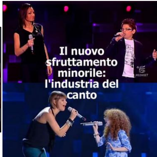
Il nuovo sfruttamento minorile: l'industria del canto