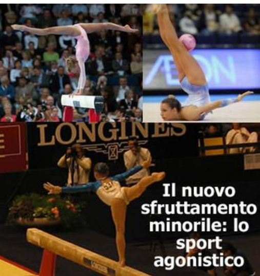
Il nuovo sfruttamento minorile: lo sport agonistico