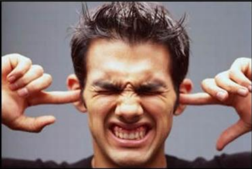
Non ne posso più di ascoltare pettegolezzi...