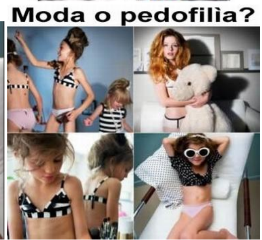
Moda o pedofilia?