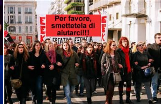
Per favore, smettetela di aiutarci!!! EROTISMO E PEDOFILIA