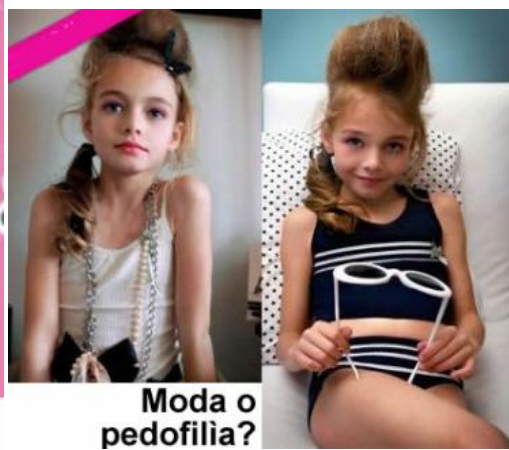
Moda o pedofilia?