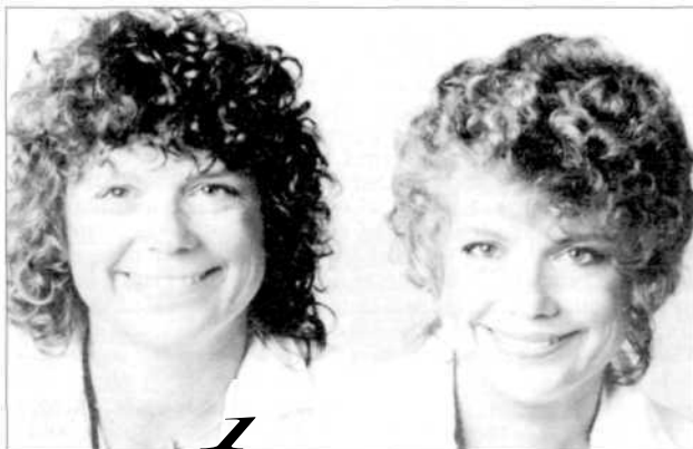
Figura 5 - Aspetto fisico e aspettative di lavoro: pochi dei soggetti che hanno partecipato allo studio di Waters erano disposti a credere che la donna rappresentata nell'immagine di sinistra (prima del trucco) fosse un'analista finanziaria, mentre nessun problema emergeva nel caso in cui veniva presentata l'immagine di destra (dopo il trucco).

Ma cosa succede nel caso in cui siano richieste specifiche abilità tecniche? Waters (1985) ha valutato l'influenza della bellezza fisica in tre casi distinti: assunzione di una segretaria, assunzione di un dipendente quadro, assunzione di un analista finanziario (Figura 5). I risultati mostrarono che l'attrattività svolgeva un'influenza significativa in tutti e tre i casi, anche se era maggiore nel caso di assunzione di una segretaria.