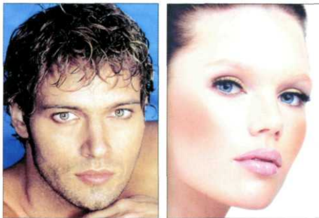
Figura 2 - Due modelli di bellezza. A sinistra l'attore Gabriel Garko e, a destra, una modella di Versace. Indagini cross-culturali hanno messo in luce caratteristiche universali e costanti nella determinazione dell'attrattività fisica. Occhi più grandi del normale e rotondi, labbra alte, strette e prominenti, viso affilato, zigomi pronunciati costituiscono elementi decisivi nel conferire bellezza ad un volto. L'uso del trucco permette alle donne di sottolineare e modificare questi attributi aumentando di conseguenza l'attrattività del viso.