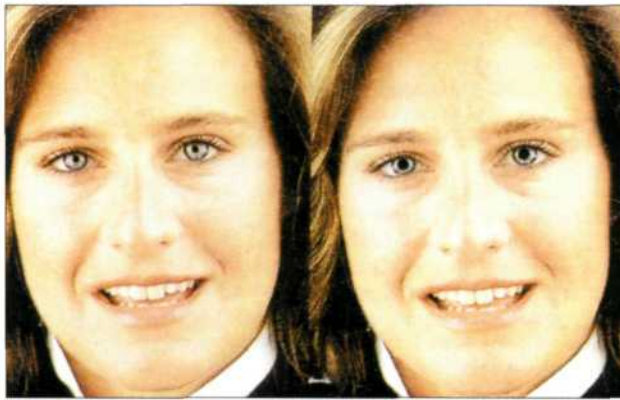
Figura 1 — Quale di queste due immagini della stessa ragazza la rappresenta in modo più attraente? La maggior parte dei soggetti tende a scegliere la fotografia di destra anche se, a prima vista, le due immagini appaiono identiche. L'unica differenza sta nelle pupille che, nella foto di destra, sono state artificialmente ingrandite.

in pubblicità: Figura 4). Inoltre, trovano più facilmente lavoro e tendono ad avere impieghi più prestigiosi. Molte ricerche dimostrano poi come la bellezza giochi un ruolo di primo piano nel campo della scelta del partner e nello sviluppo di rapporti perso-