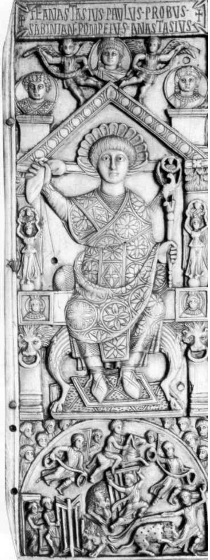
7. Dittico del console Anastasio, sec. VI (a. 517). Parigi, Bibliothèque Nationale, Cabinet des