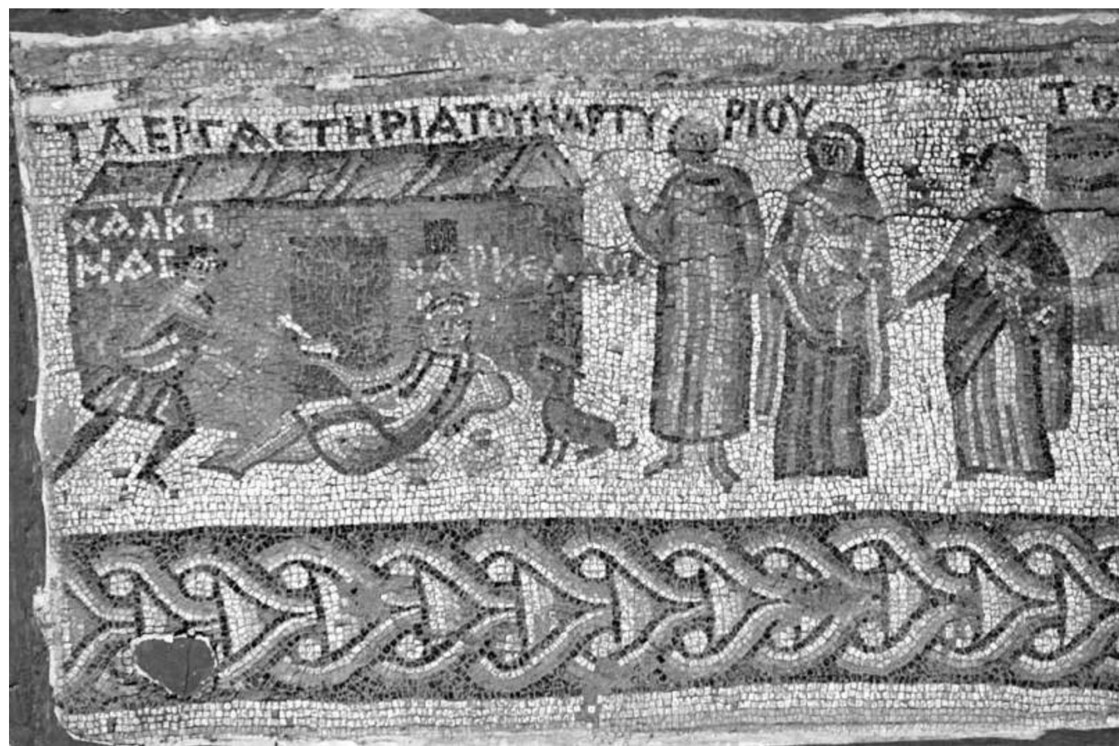
5. Veduta di Antiochia. Mosaici di Yakto, particolare, V sec. Antiochia, Museo di Antichità.