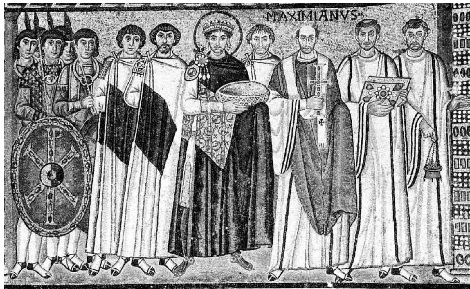
8. Giustiniano e la sua corte. Mosaico, sec. VI. Ravenna, chiesa di San Vitale.