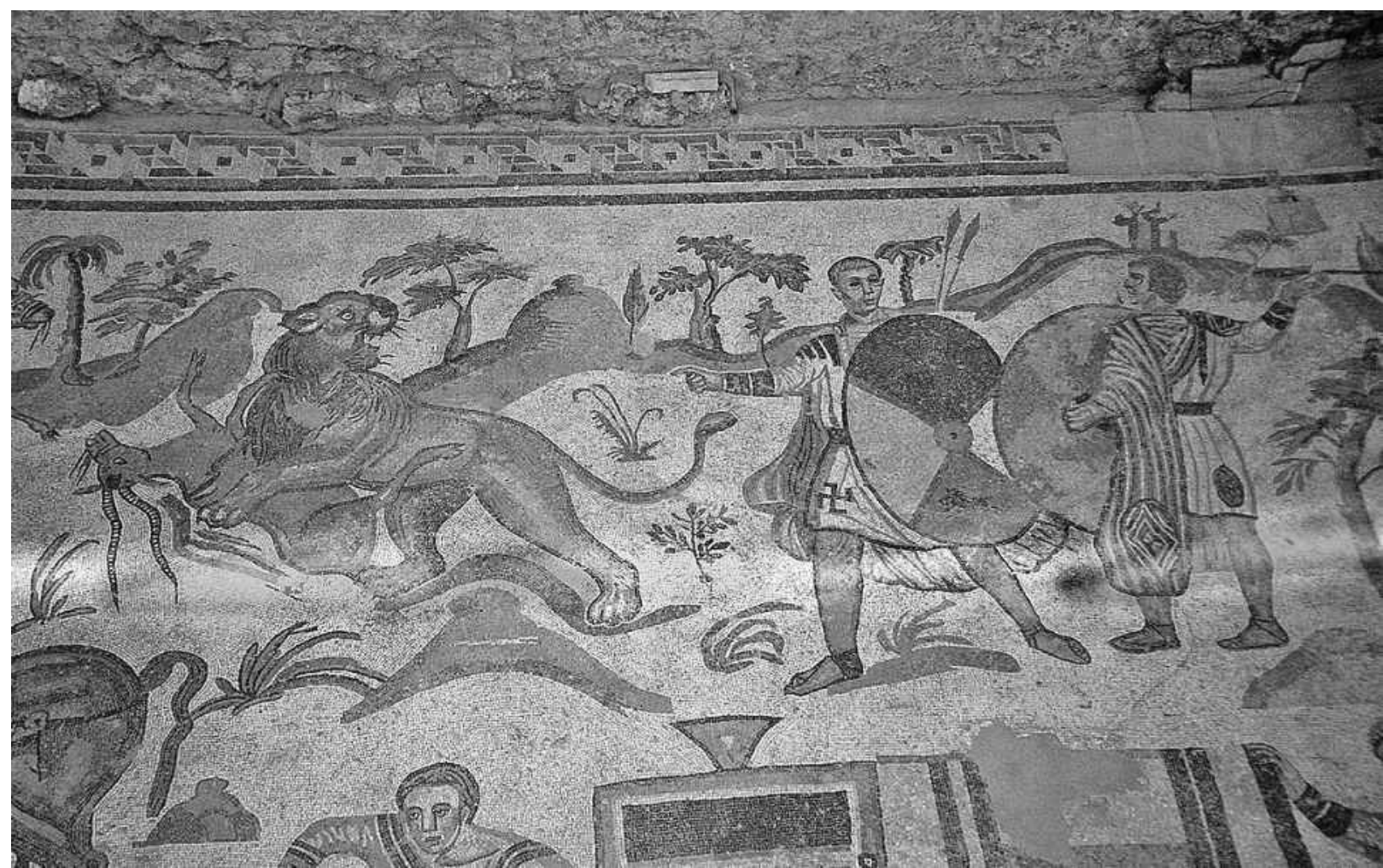
2. Scena di caccia. Mosaico, particolare, sec. IV. Piazza Armerina (Enna), villa tardo romana.