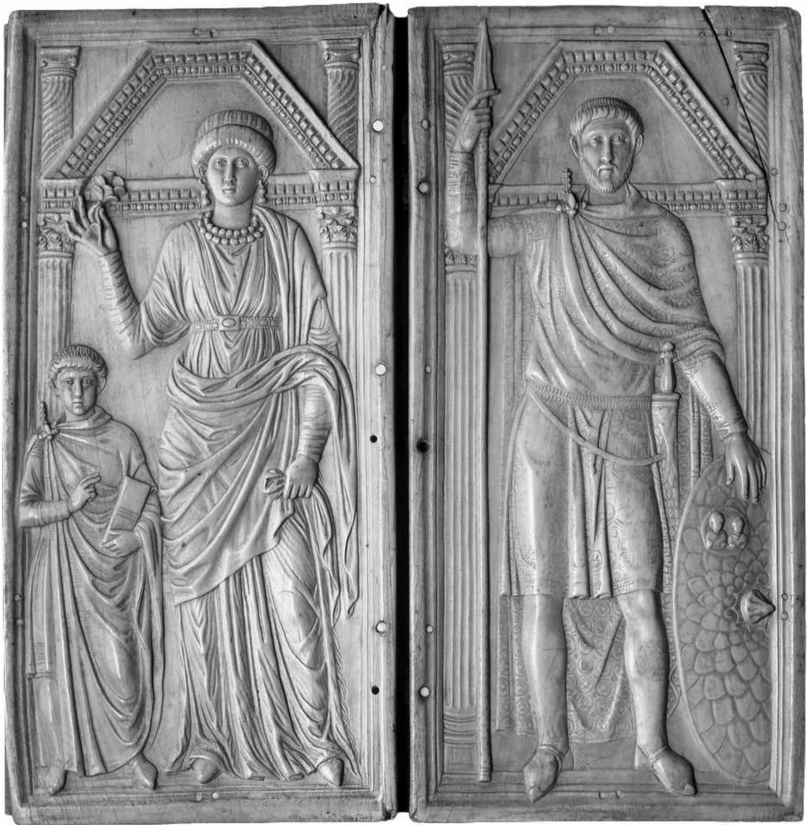
4. Stilicone con la moglie Serena e il figlio Eucherio. Avorio, dittico di Stilicone, a. 400 ca. Monza, Museo del Tesoro della Cattedrale.