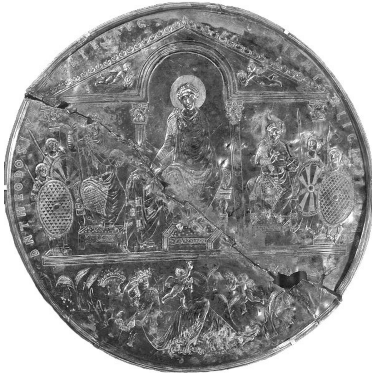
1. L'imperatore Teodosio I. Missorio d'argento, sec. IV (a. 389 ca.). Madrid, Academia de la Historia.